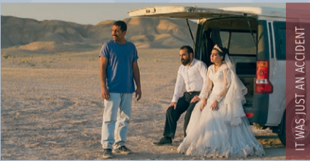
IT WAS JUST AN ACCIDENT