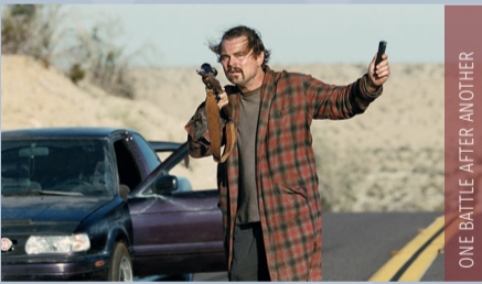
ONE BATTLE AFTER ANOTHER